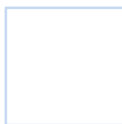
ผู้อำนวยการวิทยาลัยอาชีวศึกษาเชียงราย กรรมการและเลขานุการ