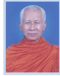
พระเทพสิทธินายก กรรมการผู้แทนพระภิกษุสงฆ์หรือ ผู้แทนองค์กรศาสนาอื่นในพื้นที่